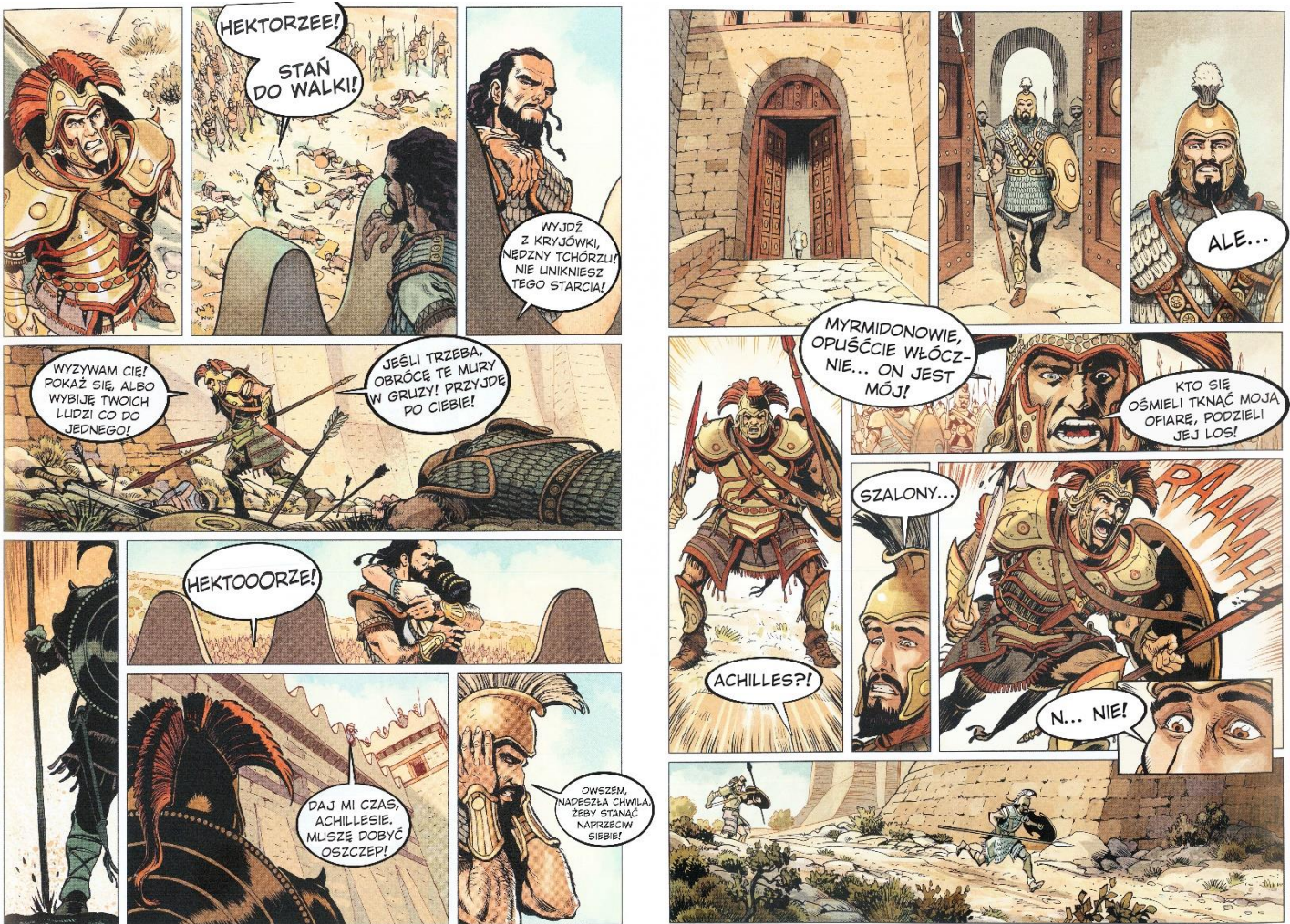
Luc Ferry, Świat mitów. Iliada, tłum. E. Kacperski, Warszawa 2021.