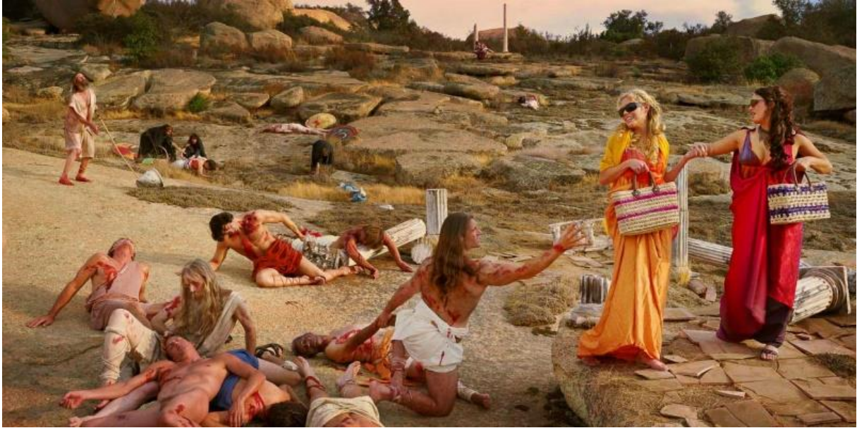
Eleanor Antin, Turystki , ( The Tourists ), 2007. Ronald Feldman Gallery, https://feldmangallery.com/