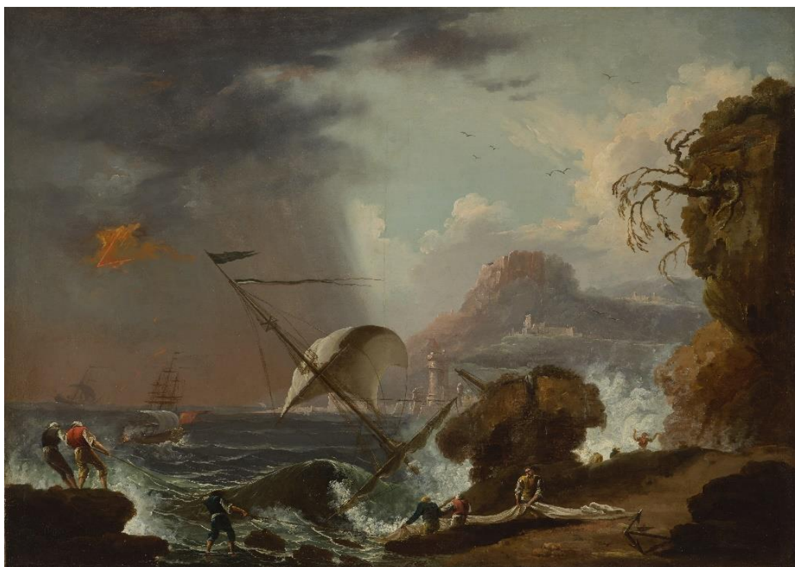
Joseph Claude Vernet, Burza morska , (1714-1789).

Zadbaj o poprawność językową, ortograficzną i interpunkcyjną swojego uzasadnienia.