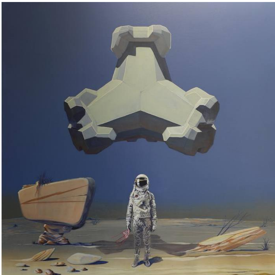
Henri Rodriguez H, L'argonaute – Orpheus , saatchiart.com.

Odpowiedź zostanie oceniona pod kątem poprawności językowej, ortograficznej i interpunkcyjnej.