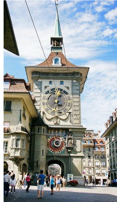
Der Uhrenturm in Bern