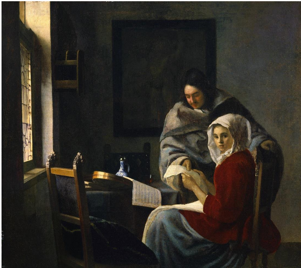
Jan Vermeer, Przerwana lekcja muzyki , ok. 1658-61, Frick Collection, Nowy Jork. https://pl.wikipedia.org/wiki/Przerwana_lekcja_muzyki_(obraz_Jana_Vermeera)#/media/Plik:Vermeer_Girl_Interrupted_at_Her_Music.jpg